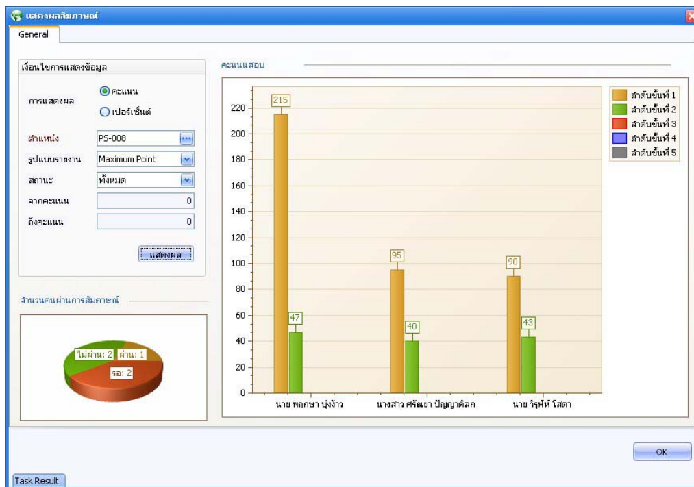
รูปที่ 6.52 ตัวอย่างหน้าจอบันทึกผลสัมฤทธิ์ More Action : Tab General